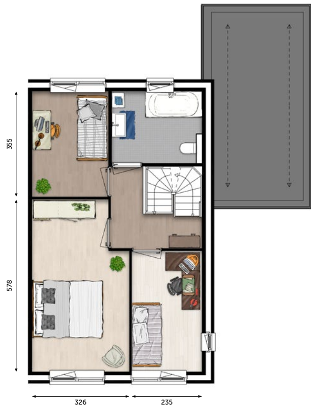
1 E VERDIEPING

De verkoopstukken zijn te downloaden op www.wonenoplangerakzuid.nl