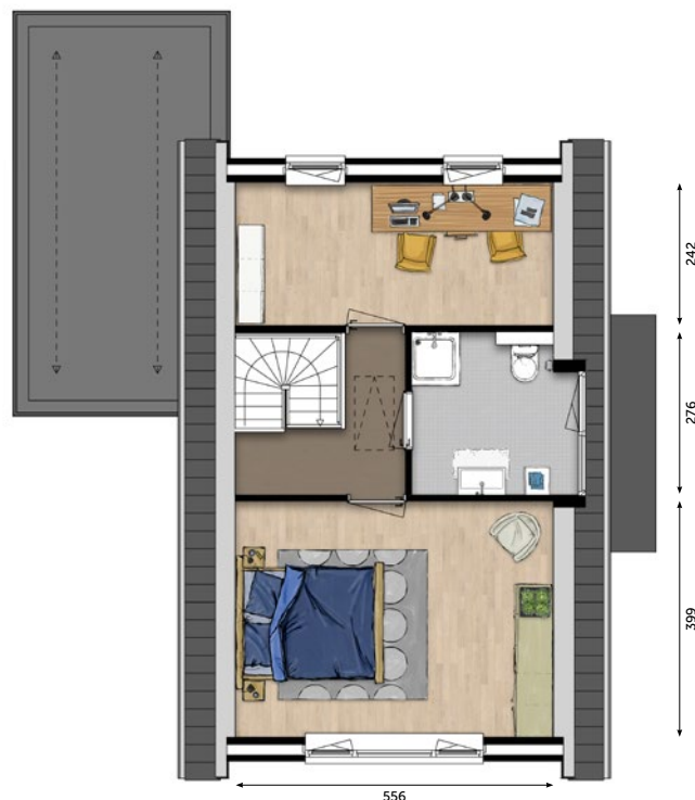
1 E VERDIEPING

De verkoopstukken zijn te downloaden op www.wonenoplangerakzuid.nl