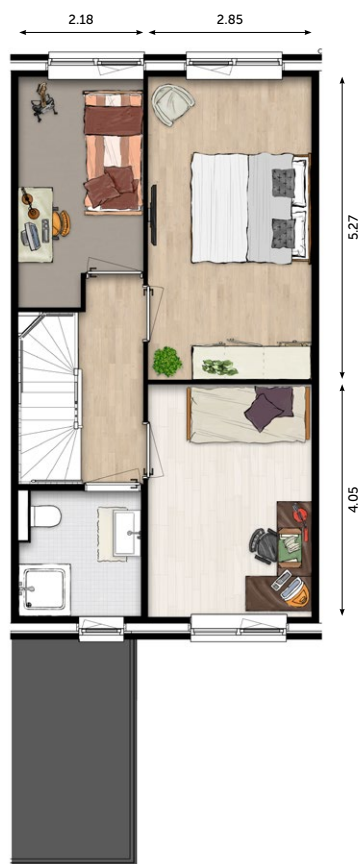
1 E VERDIEPING

De verkoopstukken zijn te downloaden op www.wonenoplangerakzuid.nl