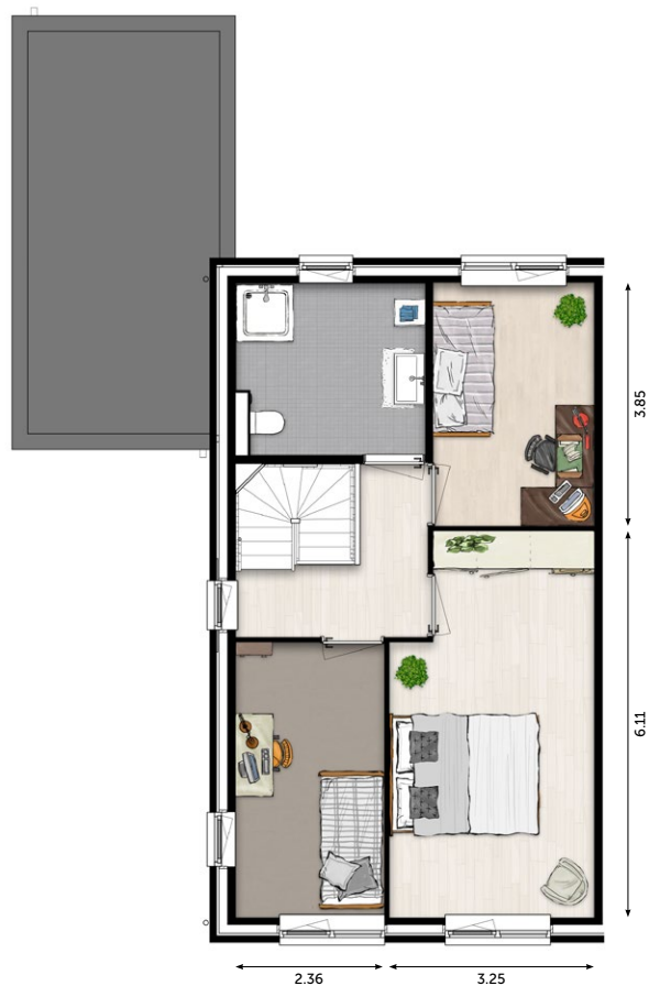
1 E VERDIEPING

De verkoopstukken zijn te downloaden op www.wonenoplangerakzuid.nl