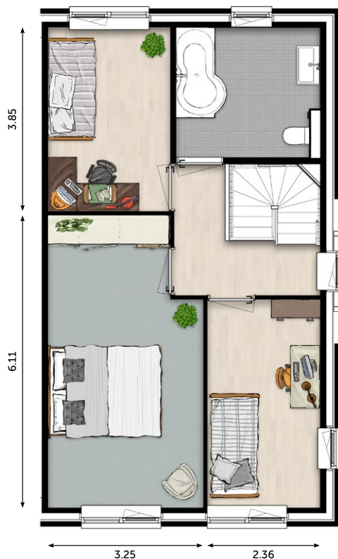
1 E VERDIEPING