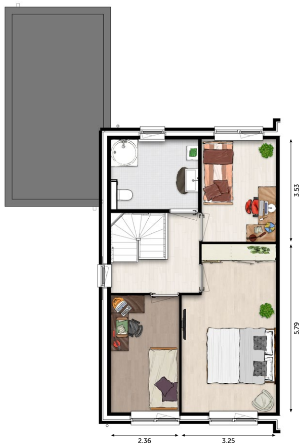
1 E VERDIEPING

De verkoopstukken zijn te downloaden op www.wonenoplangerakzuid.nl