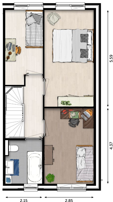
1 E VERDIEPING