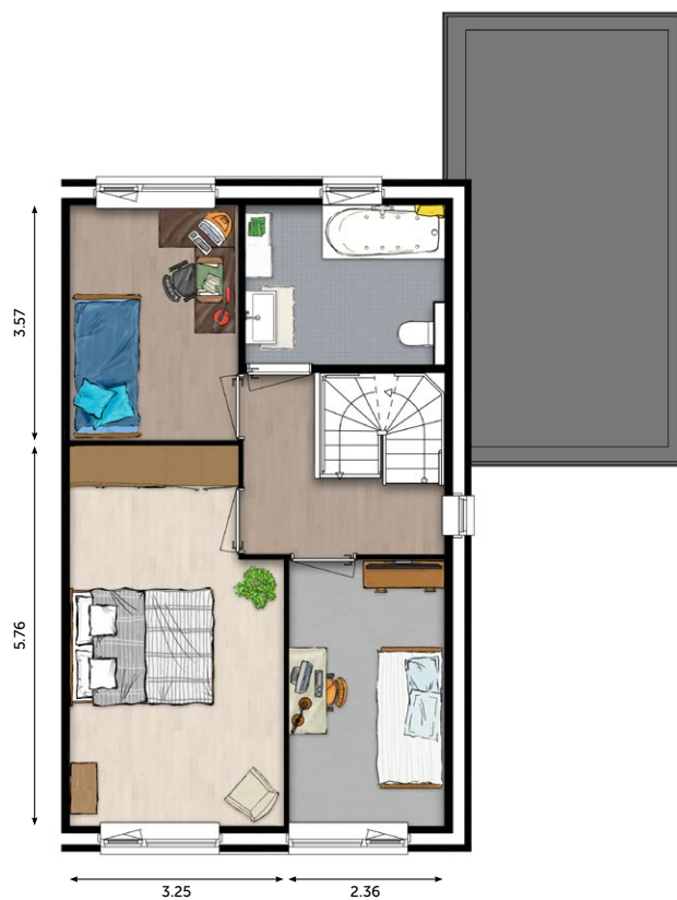
1 E VERDIEPING

De verkoopstukken zijn te downloaden op www.wonenoplangerakzuid.nl